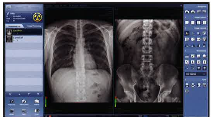
安定した高画質を実現