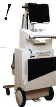
折りたたんでコンパクトに

軽量、コンパクト、コードレス化で様々な撮影環境に対応すべく、最適な出力による高画質を可能にしました。 コードレスでの撮影が可能なDC (バッテリー) と AC (AC100Vコンセント) の両方式を可能にした『ハイブリッド電源 (2電源装備)』を標準搭載し、緊急時の突発的な撮影要請にも常に対応可能です。